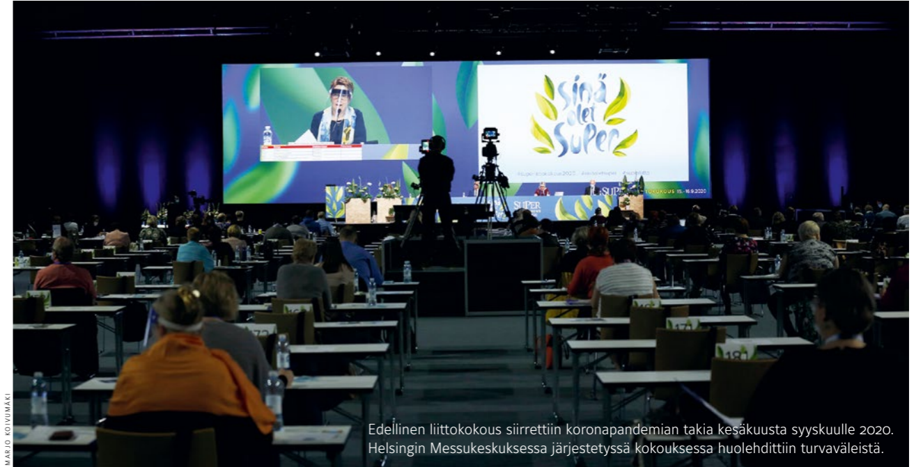
Edellinen liittokokous siirrettiin koronapandemian takia kesäkuusta syyskuulle 2020. Helsingin Messukeskuksessa järjestetyssä kokouksessa huolehdittiin turvaväleistä.

SUPERissa päättäjät ovat jäseniä, ja jäsenet valitsevat omat päättäjänsä.