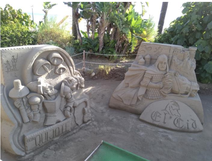
Hiekkataiteilijoiden hienoja teoksia oli monia.

Benalmadena jossa asuin oli viihtyisä 67.000 asukkaan kaupunki Aurinkorannikolla. Siellä oli pieniä kauppoja, ravintoloita ja kahviloita joissa viettää vapaa-aikaa. Päivittäin kävin rannalla kävelemässä, jossa oli hyvä todella pitkä kävelykatu. Aurinkorannikon rantoja voi kävellä kilometritolkulla, ja ravintoloita ja kahviloita on jatkuvasti.