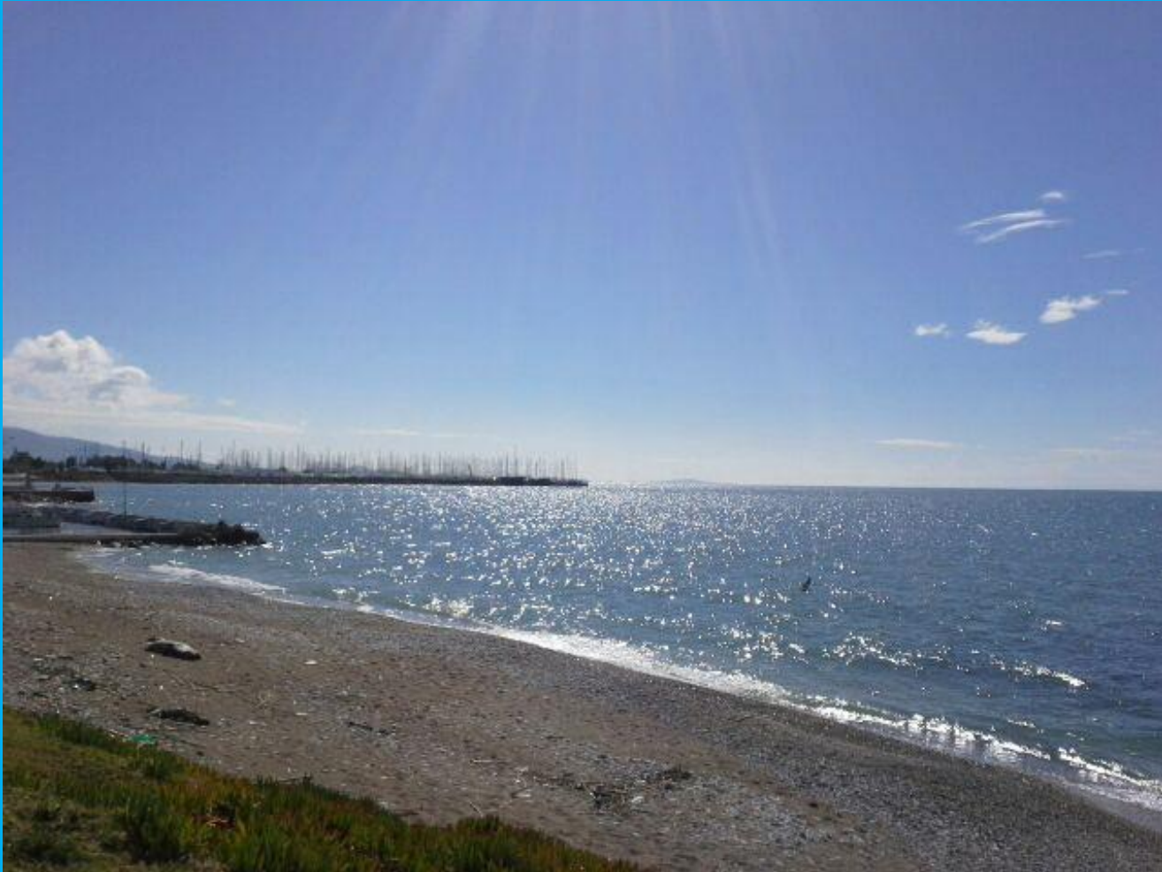
Paleo Faliron rantaa