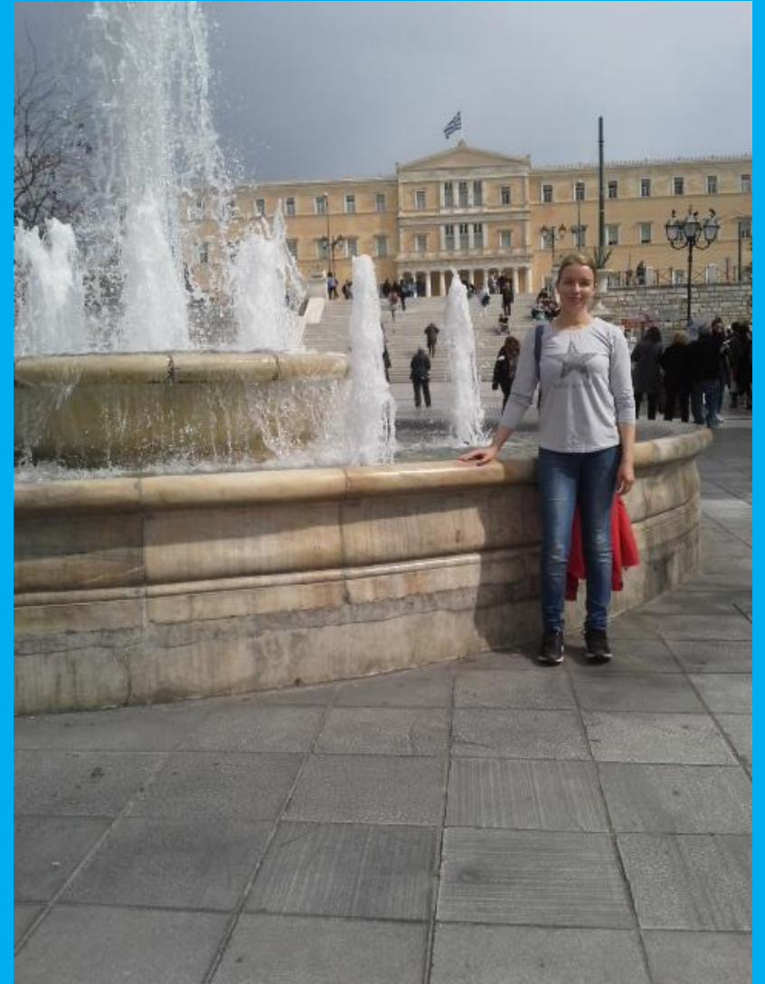
Ateenan keskusaukio Syntagma